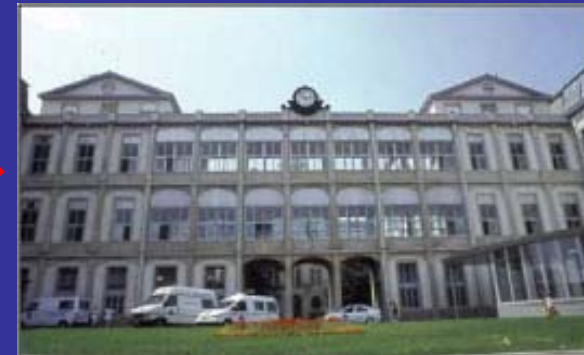
Centre Ortopedique Albert Trillat